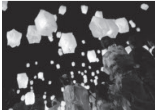
「YOU達HAPPY映画版 ひまわり」の撮影で行われたランタン上げには大勢の市民が参加

このほかにも、那珂川の河川敷や平群山など本市の豊かな自然を生かした撮影も増えています。