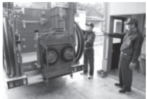
機材の点検を行う団員

消防団では、新型コロナウイルス感染症の感染拡大を防止するため、今年度の市消防団夏季点検や操法大会が中止となり、活動が行えない状況となりました。そのため、6月27日(土)から7月5日(日)にかけて、各分団部で必要最小限の人数により消防車両・消防資機材・消防詰所の点検などを行いました。昨年の令和元年東日本台風(台風19号)や今年初めの火災の多発など、消防団の地域防災への役割が大きくなっており、有事の際に万全の体制で出動できるように各