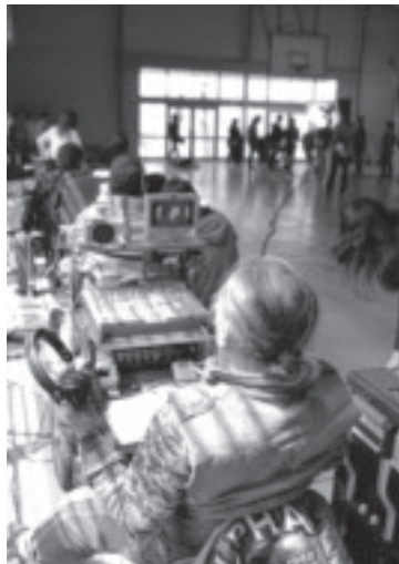
平成18年に旧境中学校で撮影された「堀の中の懲りない女たち〜宇都宮女子刑務所2006」の撮影風景

撮影候補地募集中 本市には例年、多くのロケの相談が寄せられ、映画やドラマなど様々な撮影が行われています。(表2) 昨年、31件の相談があり、そのうち12件の撮影が行われました。市のフィルムコミッションでは、より多くの市民のみならず、企業の協力のもと、市の知名度向上・イメージアップおよび観光振興に貢献するとともに、撮影