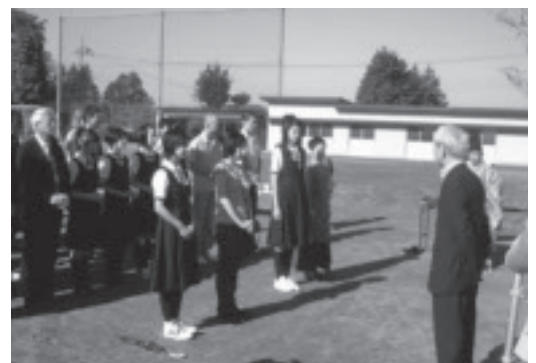
栃木県内オールロケで撮影された「檸檬のころ」のクランクインの様子

件数を増やしていくため、市内のロケ候補地を募集しています。店舗やオフィス、会議室、工場、倉庫、病院、廃墟、空き地などがロケ地の候補になり、登録されたロケ地は市公式ホームページに掲載し、必要に応じて制作会社に提供します。 ロケの候補地として登録を希望する人は、市公式ホームページを確認し、登録申込書にロケ候補地の画像データを添えて市商工観光課までお申し込みください。 撮影のサポートも募集しています 映画やドラマなどの出演者や撮影スタッフが現場で食べる「ロケ弁」を配達する業者も募集しています。時間指定された撮影現場への配達や肉・魚・魚メインの2種類に分けることができる業者が対象になっています。中でも撮影現場に出張し、食事の提供だけでなく、食事をする場所のセッティング