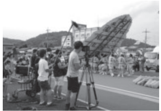
「YOU達HAPPY映画版 ひまわり」で山あげ祭のシーンの撮影

また、近年、映画やドラマなどの作品に登場した場所を巡る「聖地巡礼」も全国的なブームとなっています。聖地巡礼では、作品を見た人が実際にその地を巡るため、市の魅力のPRにつながるほか、経済の活性化も期待されています。