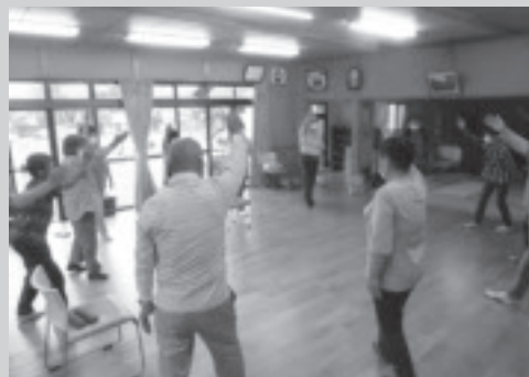
14日(火)から活動再開となった上川井ふれあいの里で身体を動かす参加者