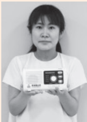
行政情報や防災情報を受信し、音声で聞き取れる戸別受信機

申請の受付は、市総務課および市健康福祉課で行っています。また、上記以外で戸別受信機の貸出しを希望する場合は市総務課危機管理グループ(☎0287-83-1117)までご相談ください。