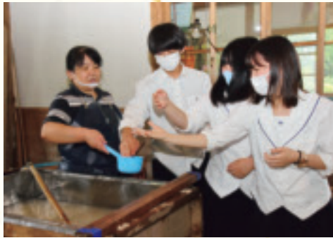
上：桁を使って自らの卒業証書をつく生徒 下：和紙の原料のひとつのトロロアオイから抽出したネリの感触を確かめる