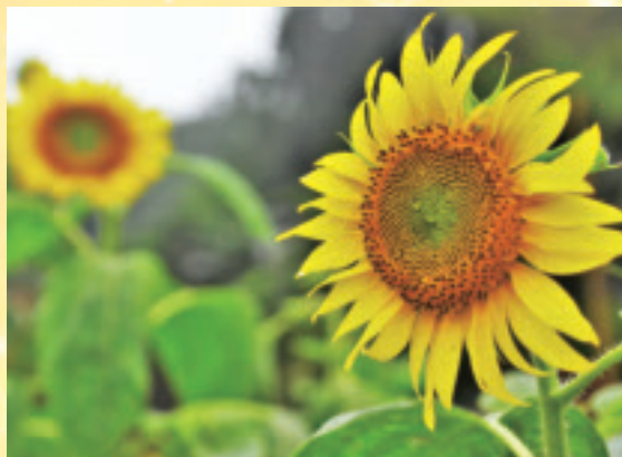
右：猿久保田んぼ公園付近で開花したひまわり、 上：龍門の滝付近で大輪の花を咲かすヤマユリ、 下：水量が増え大迫力の龍門の滝