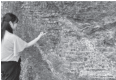
積み重なり地層となっている様子(滝田地区)

「海成層」付加体とあるように、八溝層群は海の時代の地層です。深海にたまった砂や泥が積み重