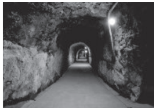
多くのドラマや映画の撮影に使われているどうくつ酒蔵