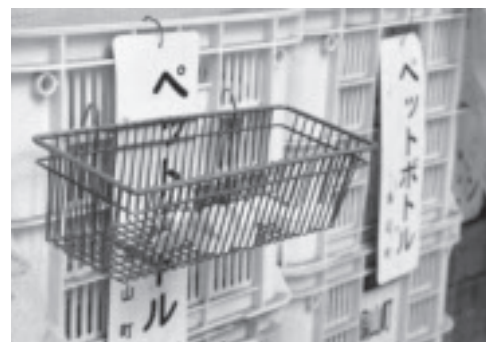
しっかりと汚れを落とし分別することが大切です

プラスチックの使用や生産の多い日本ですが、プラスチックのリサイクル、有効活用が進んでいるとも言われています。しかし、この有効活用には、焼却することで発生した熱をエネルギーとして活用する方法が多く含まれています。地球温暖化が問題となっている中、プラスチックの焼却処理を推進することは、温室効果ガス排出ゼロを目指すパリ協定の理念や2050年までの温室効果ガス排出量80%削減を目指す