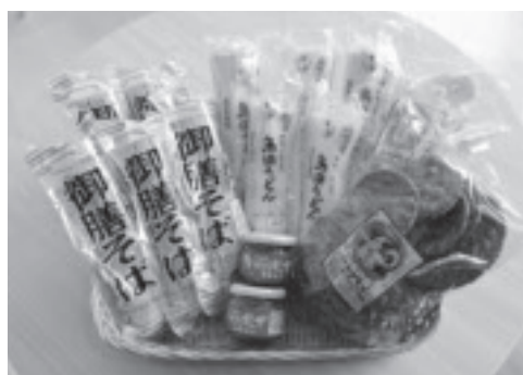
ふるさとを離れて暮らす学生に送られる学生応援ふるさと便