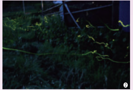
①色とりどりの花を咲かせたアジサイ（龍門の滝）、 ②横枕の明星池のほたる、③富士見台工業団地入口の池で花咲く蓮の花、④ホタルブクロ（龍門の滝）