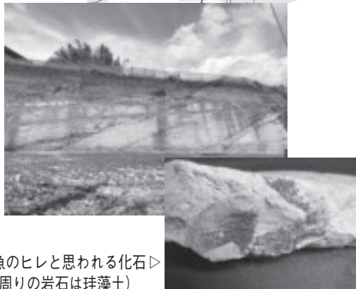
魚のヒレと思われる化石(周りの岩石は珪藻土)