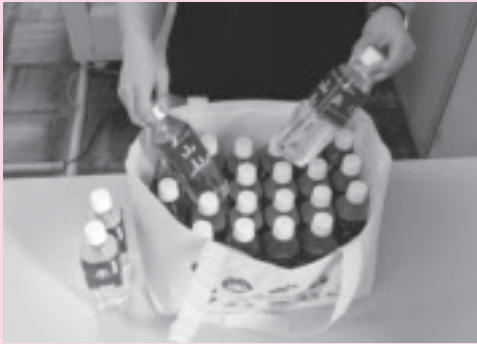
上:キャッチフレーズの入った表面デザイン 上右:裏面デザイン 下:大容量のエコバッグ

グの口部分は巾着仕様となっています。プラスチック製レジ袋が全国で有料化となったこの機会に、日頃からエコバッグを持ち歩き、不要なレジ袋を使用しないよう、できることから工夫してみませんか？