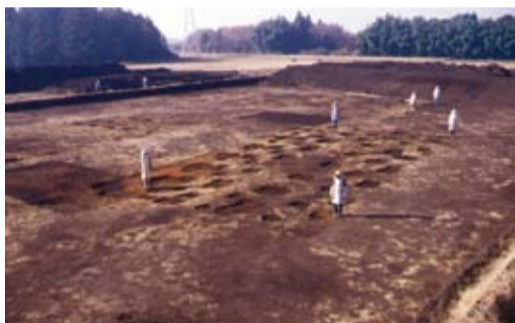
調査中の長者ヶ平官衙遺跡

議会を傍聴することは、市政を知っていただく最も良い方法です。くわしくは、議会事務局までお問い合わせください。(TEL0287-88-7114)