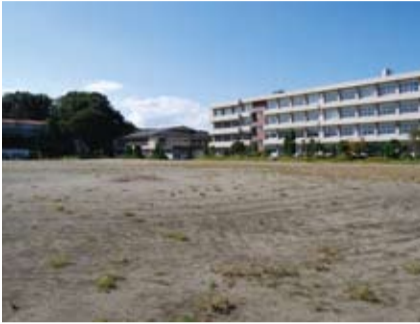
メガソーラー候補地(旧七合中学校)

関係機関と協議を進めており、旭交差点と山あげ大橋間は、烏山土木事務所において両側歩道と右折レーンを設置した本格的な道路整備をする方向で進めている。