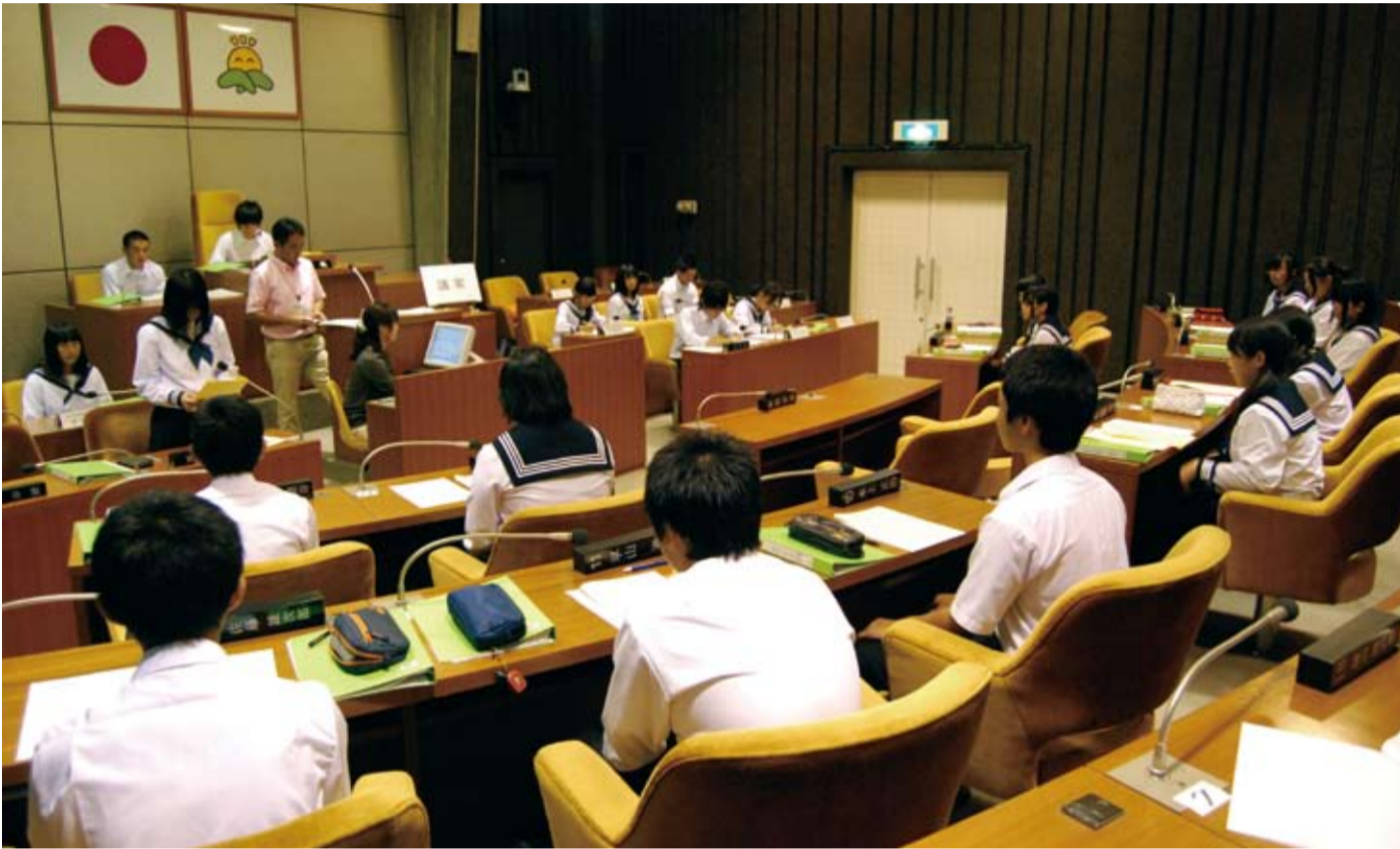
中学生が模擬議会（9月25日、26日に議場で実施した市職員出前講座。記事は6面に掲載）

9月定例会を9月4日(火)に招集し、9月14日(金)までの11日間の会期で行いました。提出された議案はすべて原案のとおり可決しました。主な議案等は次のとおりです。 ＊なお、議決した議案の内容など、詳しくは「広報那須烏山第85号」をご覧ください。