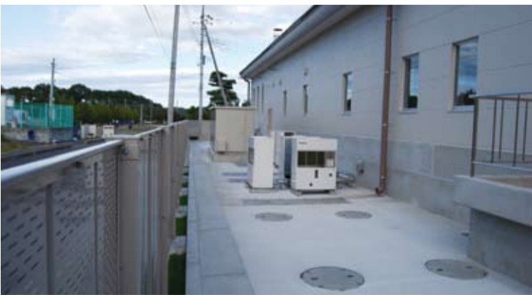
このコンクリートの下に浄化槽が埋まっている