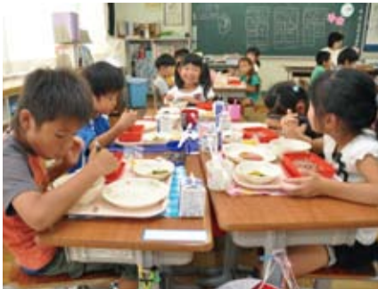
給食を食べる児童(荒川小学校)