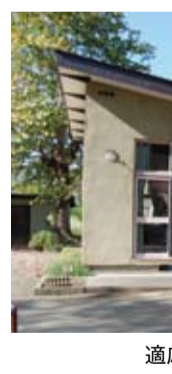
適応指導教室(レインボーハウス)

危機管理室長 罹災証明は随時発行している。申請があれば、復旧支援金の対応もしている。