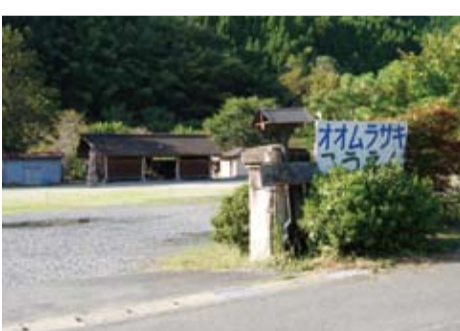
大木須の「オオムラサキ公園」

◎市長 本市では地域の特性を活かした農産物や加工品の特産化を進めている。特に地域おこしにつながるような特定農産物の栽培や加工を支援し、本市独自の特色ある付加価値の高い商品の開発を目指している。これまでに芋焼酎、夏そば、食用菜種油を商品化。またJAなす南くり部会の「ぼろたん栗」、烏山線縁起駅の旅せんべい組合の「縁起駅の旅せんべい」、観光協会の「梅みそドレッシング」、JAなす南野野菜部の「カラス大根」等の商品化にも成功している。一方では民間業者との協力体制による特産品の共同研究開発も進めている。平成23年1月にフタバ食品と協定を締結し、これまでに中山かぼちゃ、南ちゃんかぼちゃ、ナシ、これらを活用した商品を試作した。PRや販売にも協力いただき商品化に向けて連携協力を進めている。