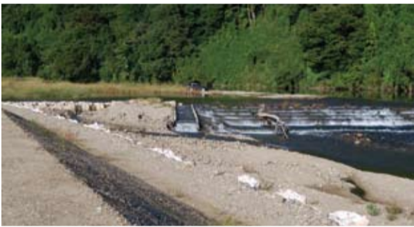
施工予定の向田の堰

農政課長 受益面積は約20畝である。補助率は約90%である。施工は多段石積み堰工である。施工の時期は11月頃を予定している。