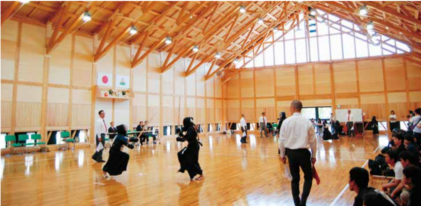
那須烏山市武道館で行われた初めての公式戦 市長杯剣道大会(平成29年6月17日)

6月定例会が6月6日(火)に召集され、6月14日(水)までの9日間の会期で行われました。提出された議案等の審議の結果は4ページに掲載しています。 なお、議決された議案の内容など、詳しくは「広報なすからすやま第142号」をご覧ください。