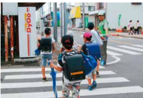
下校する児童と子ども見守り隊員

(問) 千葉県松戸市で女児が殺害された事件の容疑者を捕らえてみれば、小学校の保護者会長であり、通学路の見守り活動に参加していた男であったことに社会は大きな衝撃を受けている。子供を狙った犯罪が繰り返されている上、通学路での交通事故も後を絶たない。無防備に近い学校は、犯人がその気になればどこからでも侵入できる状況にあり、地域の見守りや警察の取り締まりだけで防げるものではない。教育長には、保護者の不安払拭のために