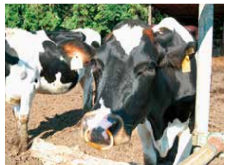
本市で盛んな畜産農業

答 5割軽減世帯の被保険者が1265人、683世帯、2割軽減世帯が1042人、531世帯、限度額超過世帯が、119世帯になる。なお、これにより税額は、5割軽減、2割軽減世帯の拡大のため約57万8千円減り、課税限度額の引き上げのため約450万円増える見込みである。