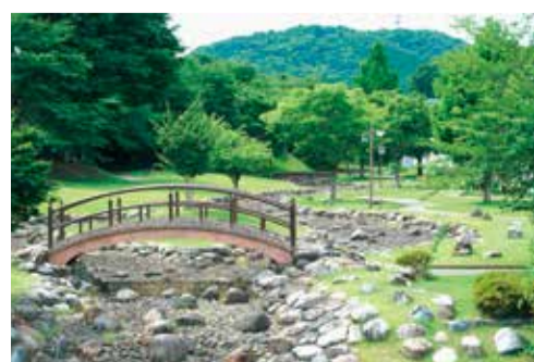
清水川せせらぎ公園Bゾーン

(問) 清水川せせらぎ公園Bゾーン(旭橋より西側)には、巨石でできた水路があるが、現在、水は流れていない。水路部分を撤去し、利便性の向上を図ることはできないか。 (答) 水路部分を撤去し、整備することにより、安全性の確保や利用面積の増加等の効果はあると思われるが、撤去には多額の費用を要する。安全で安心して利用できるよう、可能な範囲で対策を講じていきたい。 「知恵と協働によるまちづくりプラン11プラス2」の達成状況について (問) 知恵と協働によるまちづくりプラン11プラス2の中で巨額の財政投資が必要とされる建築物系公共施設について、達成状況を伺う。 (答) 公共施設の整備につ