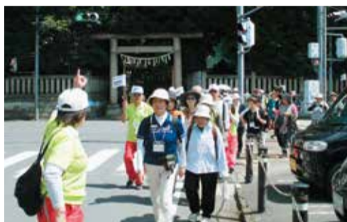
健康マイレージ対象事業のひとつ市民ハイキング

答 認定された場合、その後、区域の決定、供用開始という法的な手続きを踏まないと、市道として移管されない。今回は移管への第一歩である。