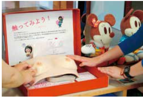
乳がん自己検診モデルを体験する女性たち

(答) 本年度より開始した健康マイレージ事業で、がん検診をポイントの対象として、検診に関心が少ない若い層への働きかけを行っている。就労者向けには、土曜日や夜間帯の実施回数を増やすこととしている。また、24時間自分の都合がよいときに予約ができ、混雑状況が確認できるウェブ予約を平成30年度から開始する。今年度は試行的・先行的に未申込者を対象として、9月頃に受診勧奨を兼ね