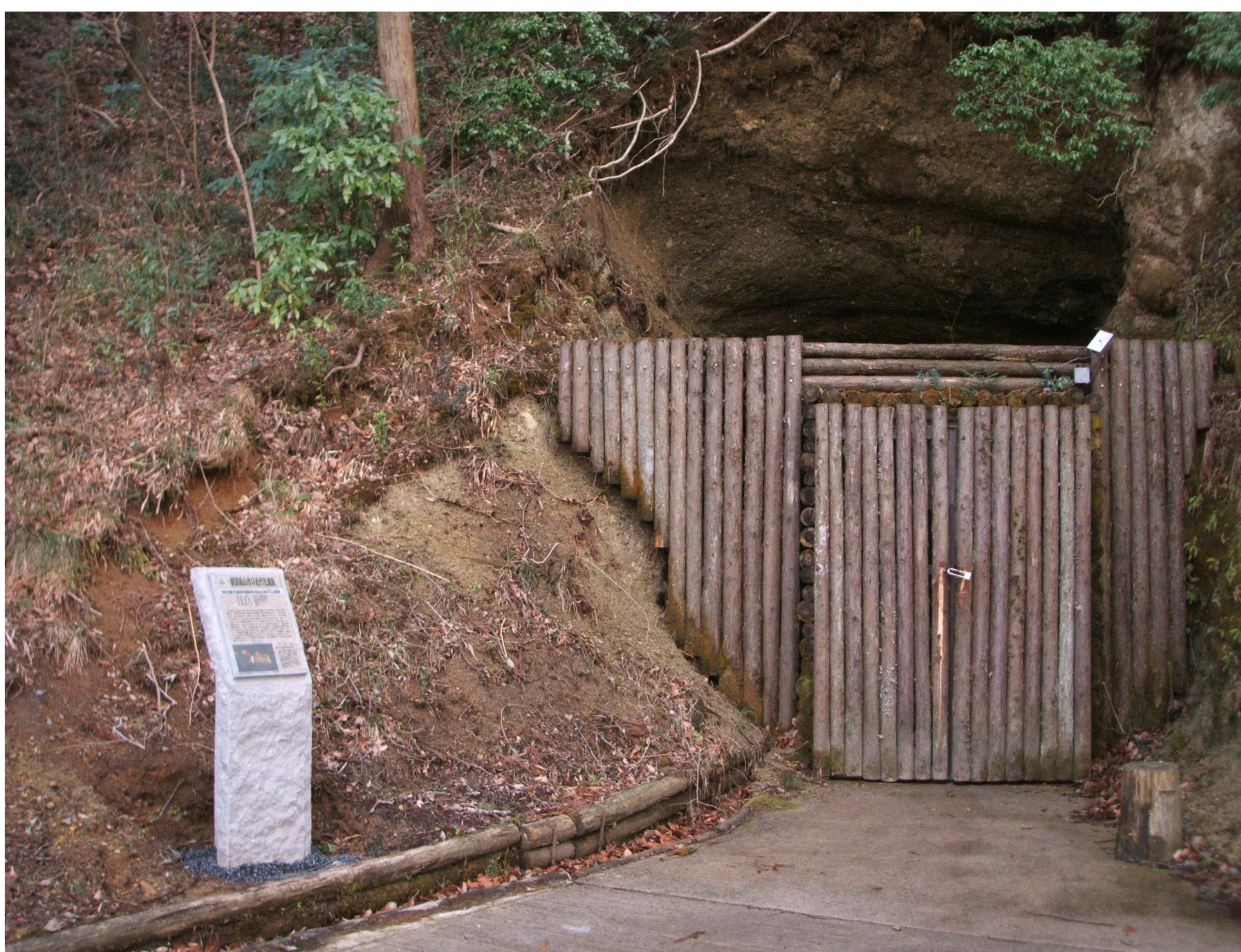
地下工場跡入口と近代化遺産解説板