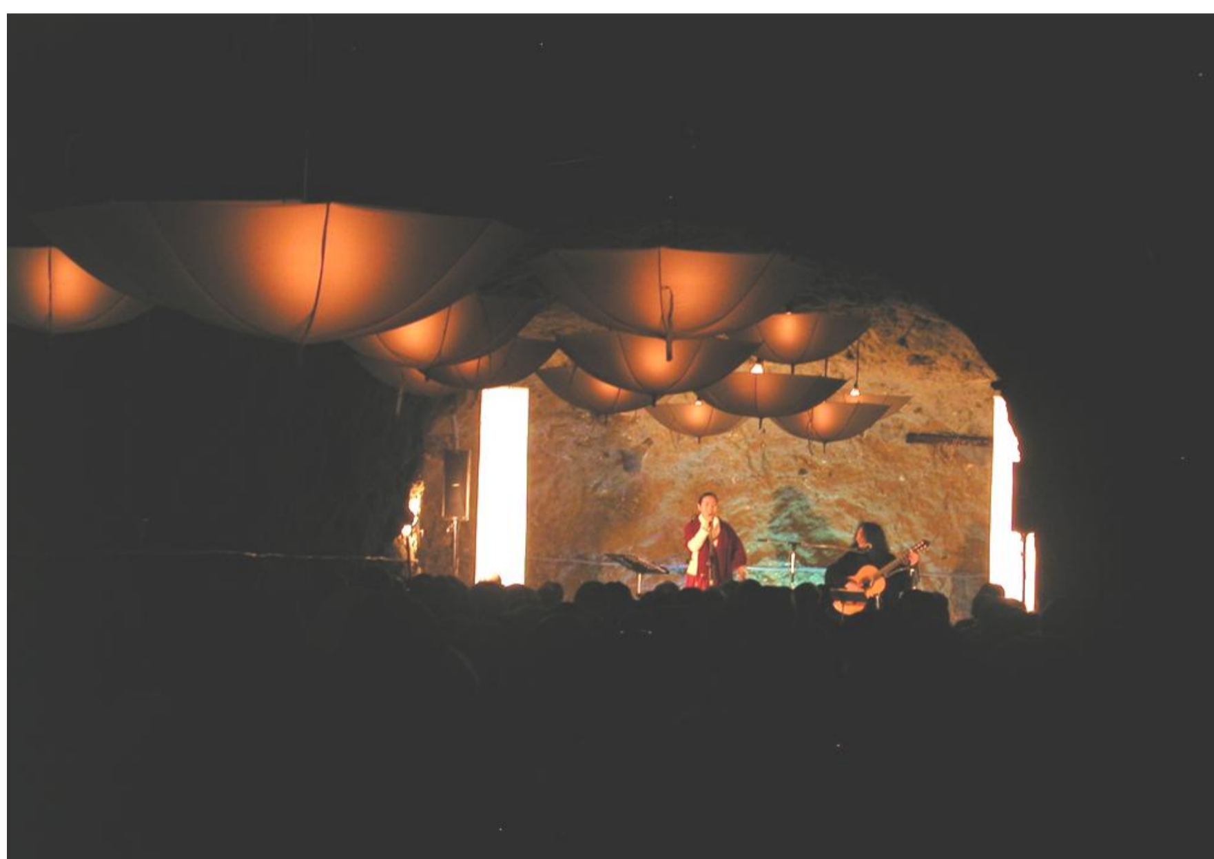
烏山和紙の創作照明とコンサートのコラボレーション(平成19年)