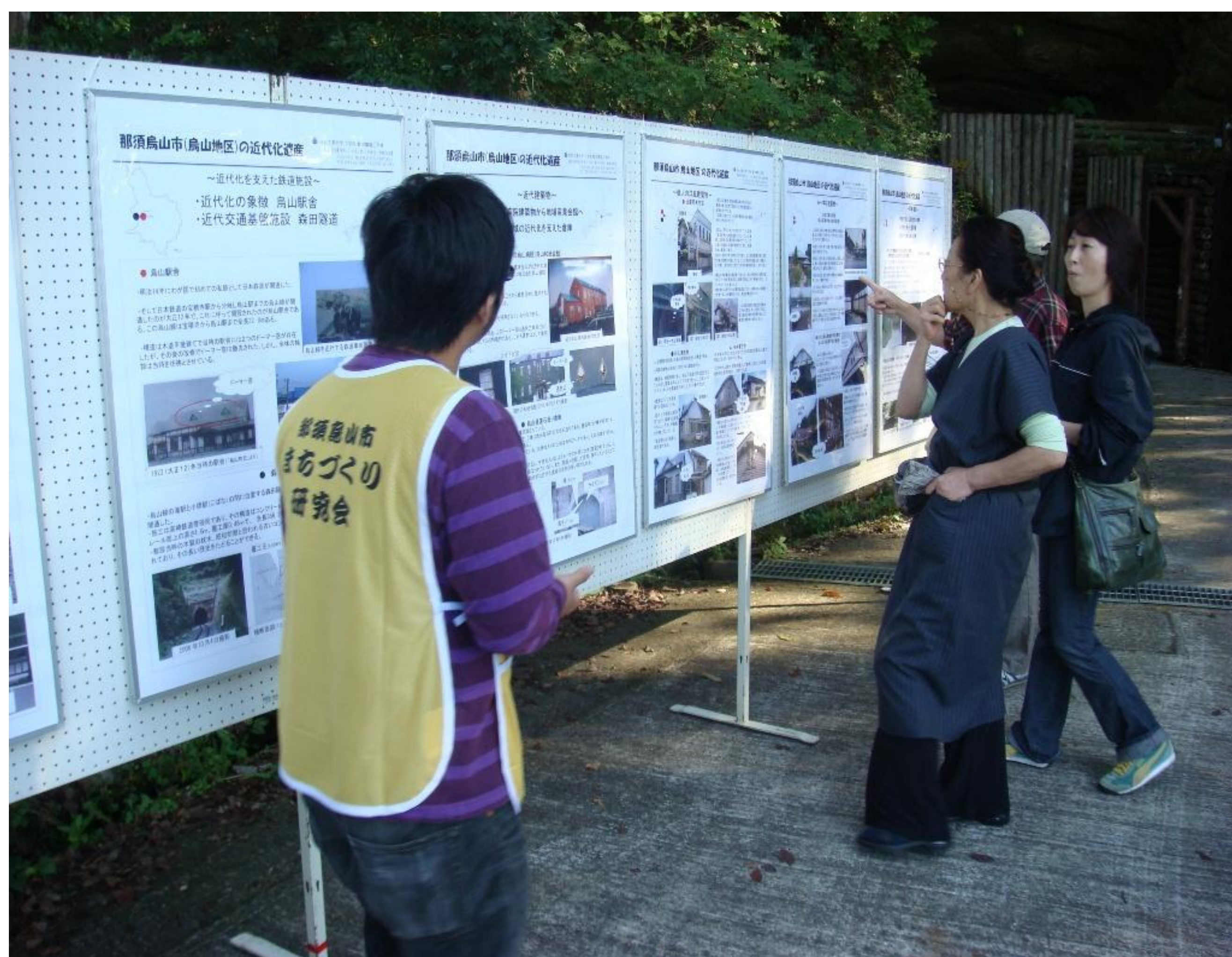
「近代化遺産全国一斉公開」におけるパネル展示風景