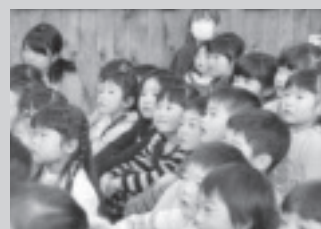
すくすく保育園観劇より。