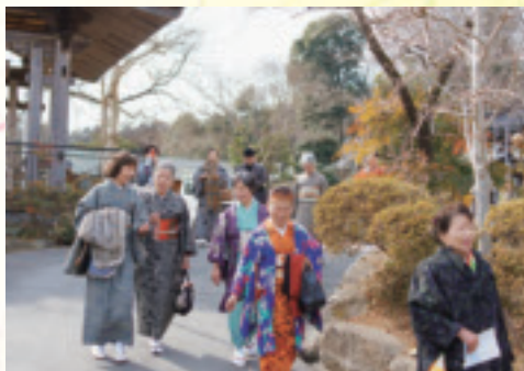
着物姿で市内を散策。