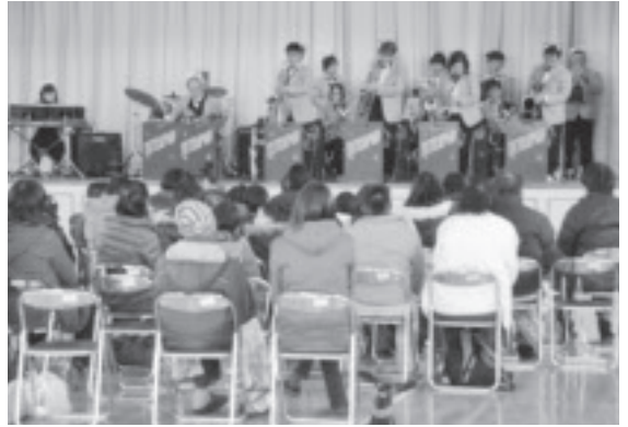
盛り上がりを見せた演奏会。

南那須特別支援学校那須烏山那珂川支部会による「卒業・進級を祝う会」のジャズ演奏会が、2月24日、野上体育館で開かれ、同支部会員や学校関係者など約100人が参加しました。演奏会は、子どもたちに生の演奏に触れてもらおうと両支部会が合同で企画したものです。当日は、25年前に宇都宮工業