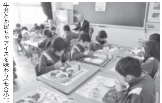
牛丼とかぼちゃアイスを味わう(七合小)。

は、那須烏山市特産の中山かぼちゃを使い、市とフタバ食品(株)で共同研究開発した特産品「中山かぼちゃアイスクリーム」も給食に出されました。子どもたちは、大好きな牛肉料理やデザートに登場に、満面の笑みで「おいしい」を連発していました。