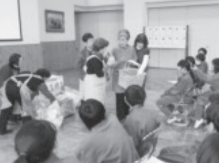
寸劇で対応の仕方を学ぶ（荒川中）。

ダー連絡会烏山支部による寸劇を通して問題点を話し合いました。終了後のアンケートでは、「認知症の人にもやさしく接してあげたい」という意見が多く見られました。