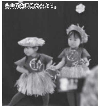
鳥山保育園発表会より。