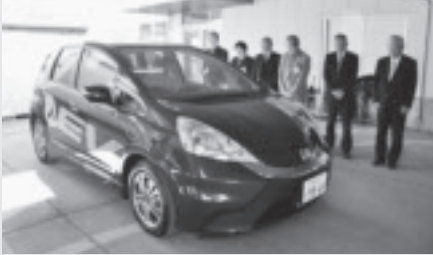
納車式で安全祈願。