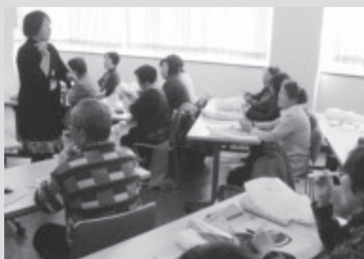
「こころを元気にする日」の集いで歯の健康から心の健康を学ぶ(2/26・烏山公民館にて)。