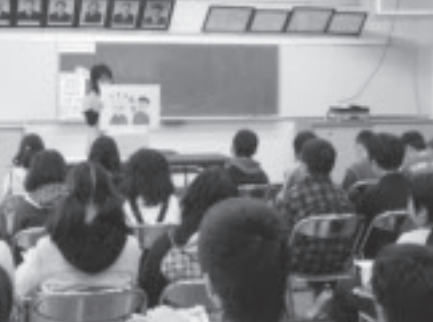
家族の接し方を紙芝居で学ぶ（荒川小）。

には江川小、1月には荒川小、2月には荒川中で開催しました。講座は、グループに分かれ、認知症への対応方法などを話し合うものです。荒川中では、消費者リ