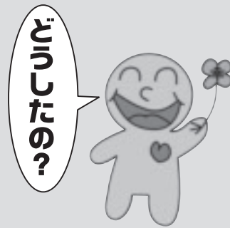
こころを元気にするキャラクター「ハピネスちゃん」

毎年2月22日は「こころを元気にする日」、2月20～26日は「こころを元気にする週間」です。市民一人ひとりにこころの健康を持つてもらうと、1月に「こころを元気にするメッセージ」を募集しましたので、