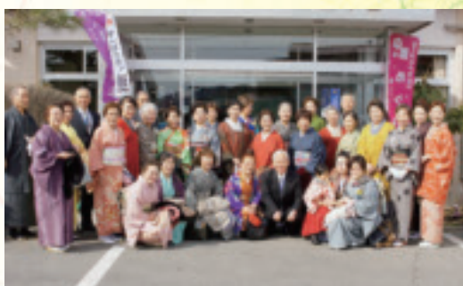
市役所を表敬訪問する参加者。