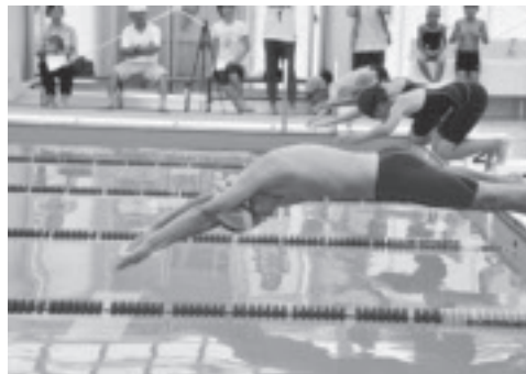
ピストルの合図でスタート。