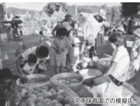
宮原保育園での模擬店。