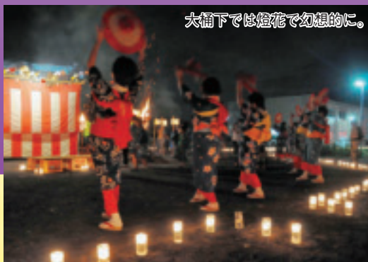
大桶下では燈花で幻想的に。