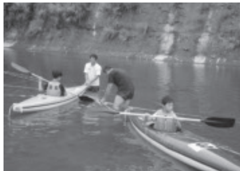
カヌーを体験する参加者。