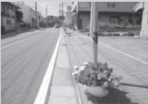
地域の緑づくりに活用。(南通り南栄会)