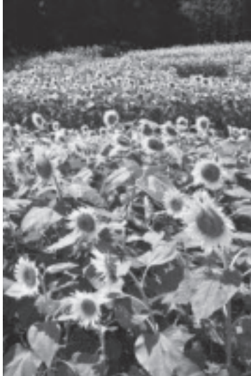
棚田を彩るヒマワリ。