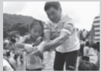
アユのつかみ取りより。