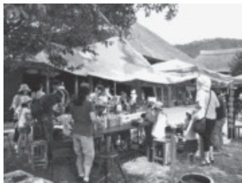
古民家に手作り作家が集合。

当日は、木工細工やアクセサリー、和紙・革・ガラス製品、陶器など、10人を超える手作り作家が、子どもたちにワークショップ（もの作り体験教室）を開き、参加者は、真剣な表情で制作に取り組んでいました。