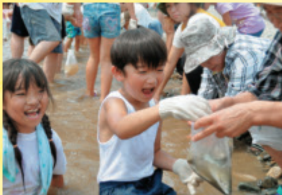
次々とアユをつかまえる参加者。