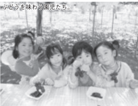
ぶどうを味わう園児たち。

子どもたちに季節の果物を味わってもらおうと、すくすく保育園では、8月30日、保育園近くの渡辺ぶどう園の協力でぶどう狩りを開きました。