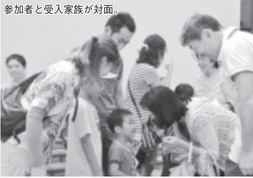
参加者と受入家族が対面。