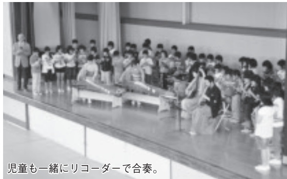
児童も一緒にリコーダーで合奏。