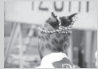
祭への意気込み(山あげ祭より)。

和光市では、毎年10組の参加者を募集しますが、キャンセル待ちがでるほど大人気で、「宿泊施設ではなく、農家に泊まれるのが魅力」と和光市職員は話していました。参加者の中には、「待ちきれず、前の晩に来てしまった」という親子もいました。