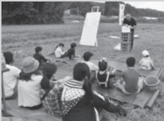
堀っこ探検会で自然を学ぶ。