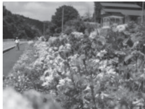
最優秀賞の大沢長寿会。

その他の参加団体 …藤田自治会、大桶上百寿会、母子寡婦福祉会、曲畑いきいきクラブ、熊田西幸齢クラブ、小倉自治会、谷浅見上老人会、あたご寿会、月次いきいきクラブ、神長もみじ会、横枕スポーツ愛好会、大桶下いきいきクラブ、滝育成会、高峰自治会、野上地区女性会、熊田西公民館、下境川辺自治会(順不同)