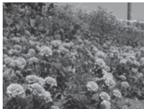
優秀賞の三箇下いきいきクラブ。