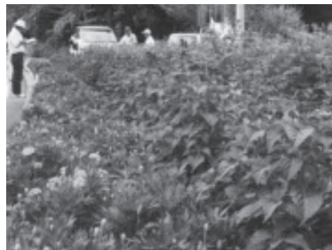
優秀賞の大金子供育成会・大金いきいきクラブ。