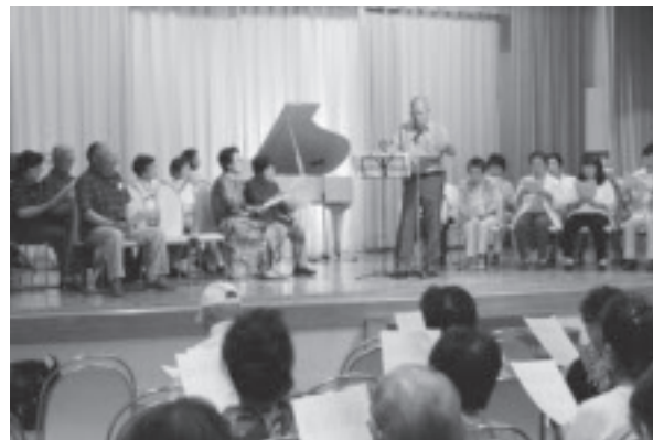
みんなで思い出の歌を楽しむ。

思い出の歌を楽しむ「那須烏山うたごえ喫茶」では、7月8日、大金温泉グランドホテルで「第1回栃木ラジオ歌謡を歌う会」を開催しました。