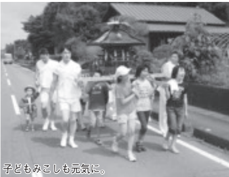
子どもみこしも元気に。

藤田八坂神社の天王祭が7月14日に行われ、南那須地区随一の大さを誇るみこしが、地区内を練り歩きました。