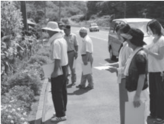
5項目にわたる現地調査。