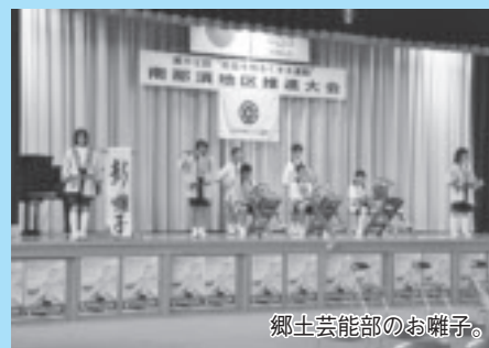
郷土芸能部のお囃子。