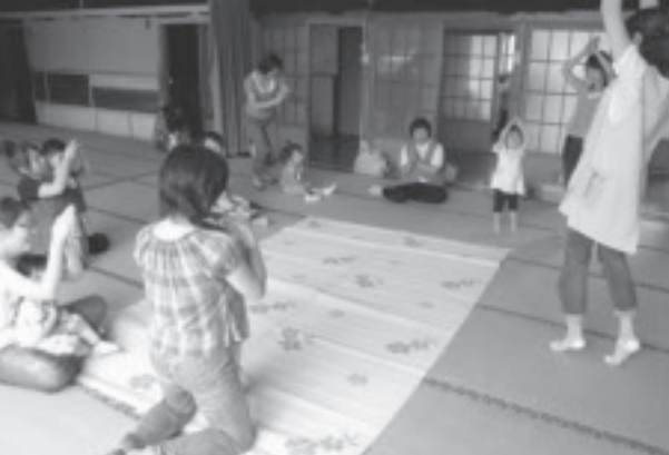
鴻野山公民館で元気に体操。

サロンは、親子の交流の場の提供、相談援助、情報提供などを目的に、こども館の保育士が地域に向いて支援するもの。体操や手遊