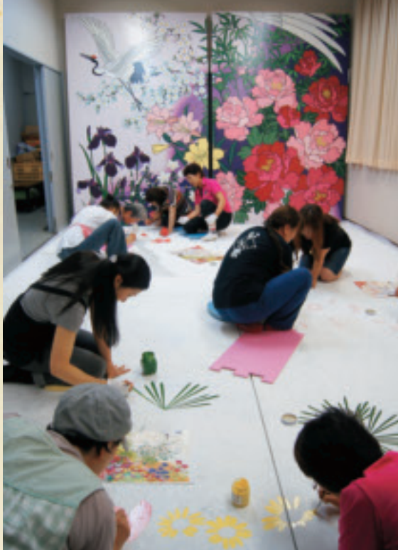
壁画制作に取り組むメンバー。

「第35回いかんべ祭」が8月17・18日、保健福祉センター駐車場で開催されます。祭を支える実行委員や多くのボランティアが準備を進め、あとは本番を待つばかりとなりました。昨年は震災の影響で実施を断念しましたが、今年の祭を復興祈念と位置づけ、5年ぶりにステージ両脇の大壁画を作成しました。