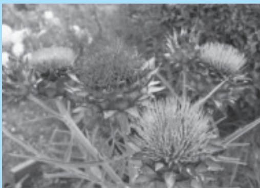
青い大きな花を付けたアザミ。