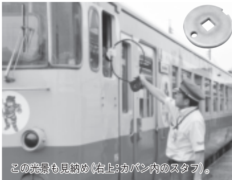
この光景も見納め(右上:カバン内のスタフ)。

JR大宮支社では烏山線の保安装置の更新に伴い、関東圏で唯一残っていた大金(ウツリ)烏山駅間の「スタフ閉そく式」を廃止し、新しい運転方式に変更しました。