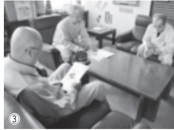
①次々と避難所に来る参加者②避難者を誘導する消防団員③災害対策本部で対応を協議。