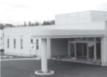
（上から）塩野理事長のあいさつ／施設を見学する出席者／新しくなった施設外観。