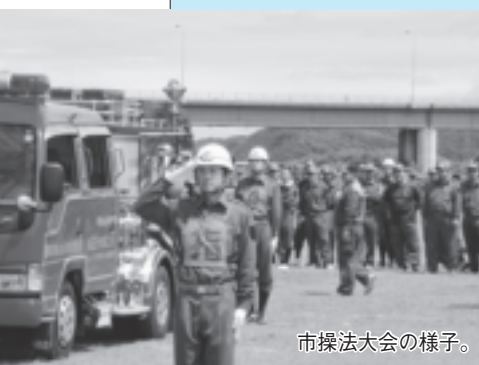
市操法大会の様子。