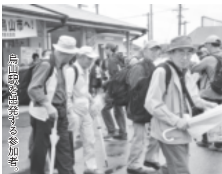
烏山駅を出発する参加者。

今回は、烏山駅を出発し、山あげ会館、和紙会館、鳥崎酒造、洞くつ酒蔵、龍門の滝などを巡る約6キロのコース。受付会場の烏山駅では、今年初の山あげ祭のPRを兼ね、泉町がお囃子で参加者を歓迎しました。