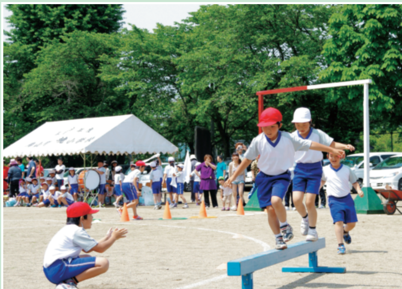
ゴールテープ目指して(6月2日、境小運動会)