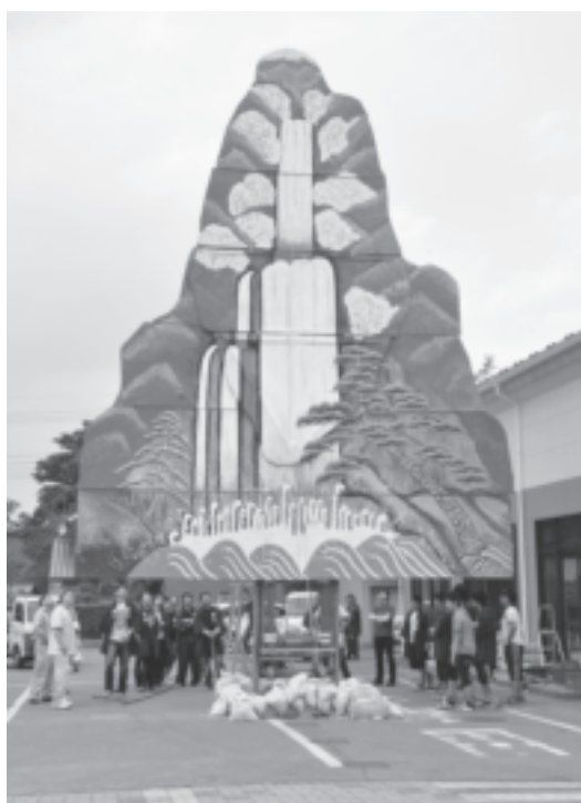
山の確認をする泉町若衆。