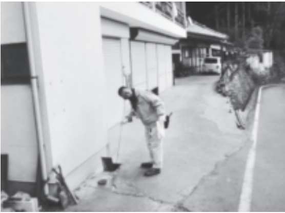
個人宅の漏水調査。