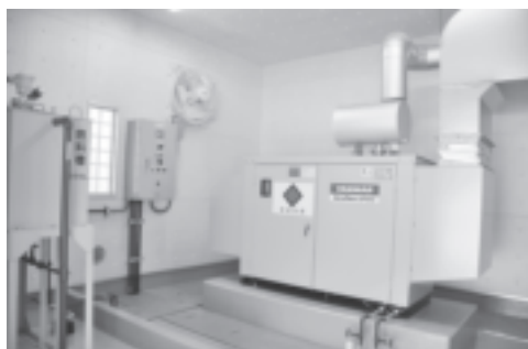
（上から）新配水池のバルブを開く／配水池まで水を送水するポンプ室／地震などの停電に備える発電機。