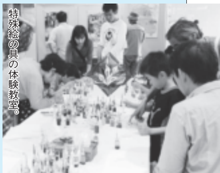
特殊絵の具の体験教室。

期間中の6月17日には、県民の日にちなんだイベントが開かれ、市では、(有)NPRによる特殊絵の具を使った体験教室や、烏山語りの会による市内の民話の語りなどを行い、来場者に市の魅力を伝えました。