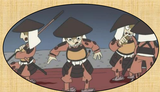
『お城を救った牛と蛭』