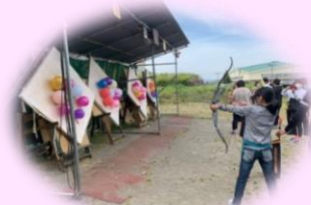
○第1回体験教室の様子