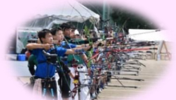
○R3.7リハーサル大会の様子