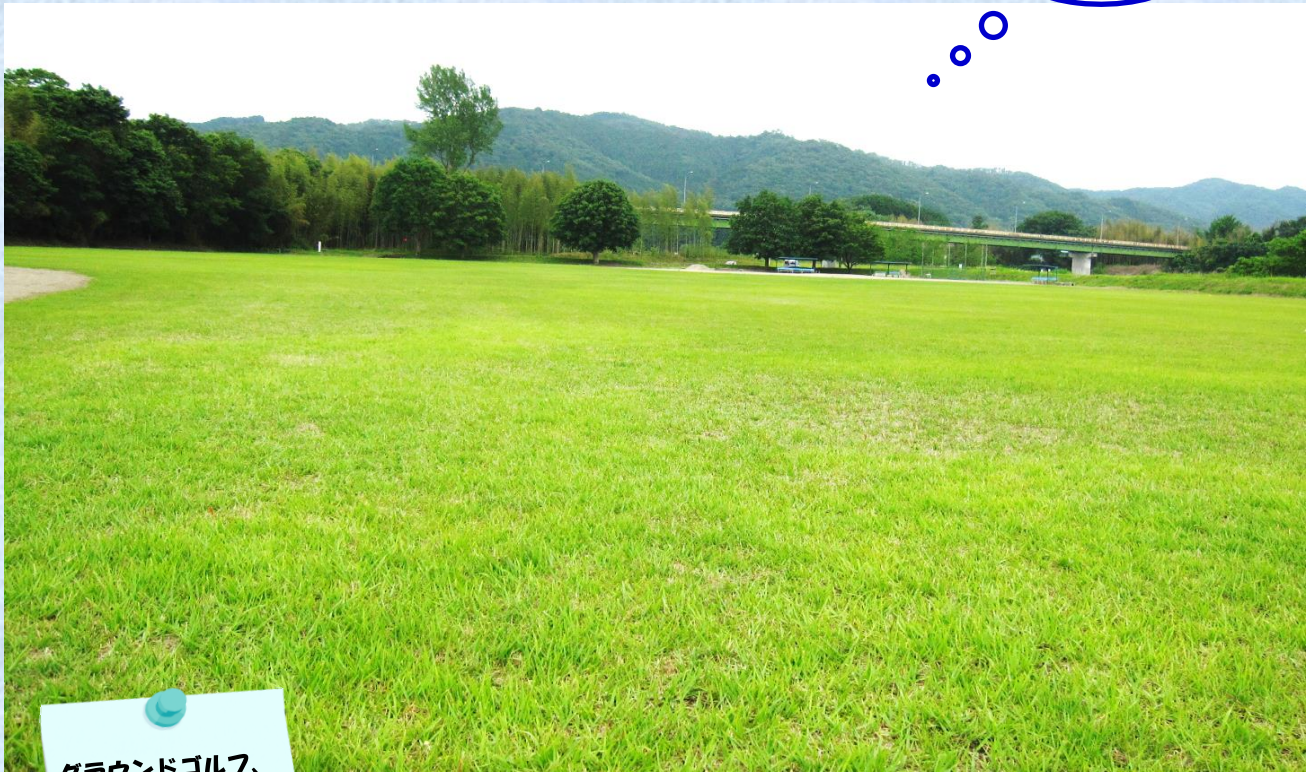
両グラウンド外野部分