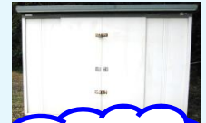
倉庫は西グラウンドに