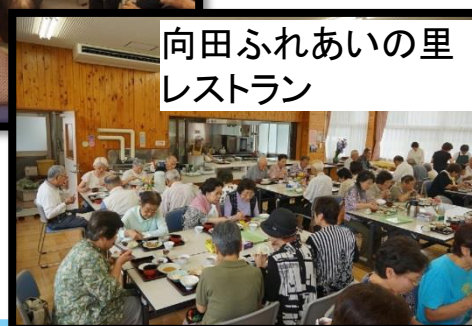
向田ふれあいの里 レストラン