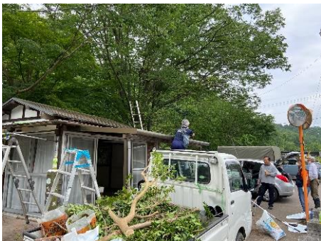
会員みんなで周辺整備（5月）

そしてついに、7月25日（土）に、なすからジオの会プチャーロによる「龍門の滝案内所」が無事にオープンしました！今後は月に2日程度、会員が滞在して随時ガイドを受け付けますので、ぜひお気軽にお立ち寄りください。