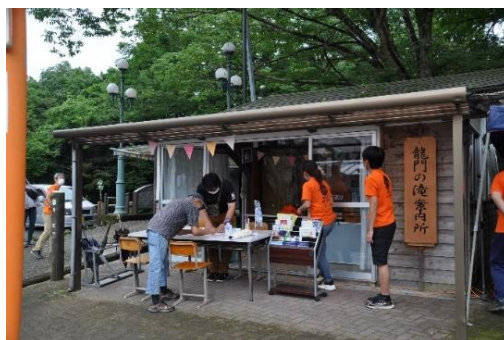
案内所のオープン時の様子