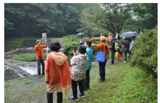
龍門の滝にてガイドの説明を聞く参加者