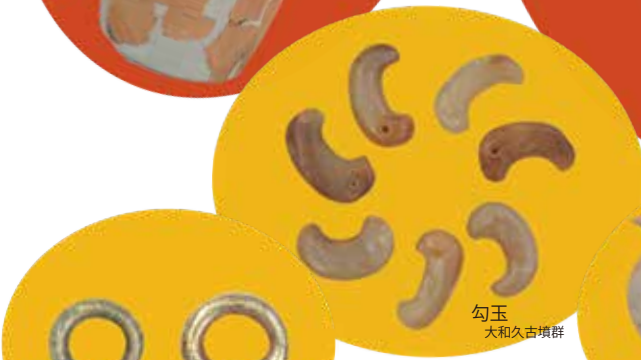
勾玉 大和久古墳群