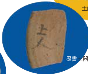
墨書土器 (上人 (僧侶)) 史跡 長者ヶ平官衙遺跡