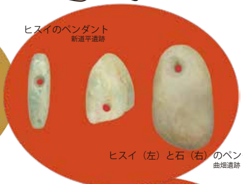
ヒスイ (左) と石 (右) のペンダント 曲畑遺跡