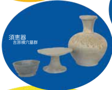
須恵器 吉原横穴墓群

北原遺跡 (高瀬) 滝田本郷遺跡 (滝田) 長者ヶ平官衙遺跡 (鴻野山) 東山道跡 (小白井) 銭神窯跡 (熊田)