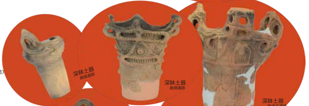
深鉢土器 曲畑遺跡