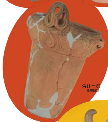
深鉢土器 曲畑遺跡

大用地前遺跡 (鴻野山) 後久保 B 遺跡 (鴻野山) 弥五郎遺跡 (福岡) 塩谷入遺跡 (三箇)