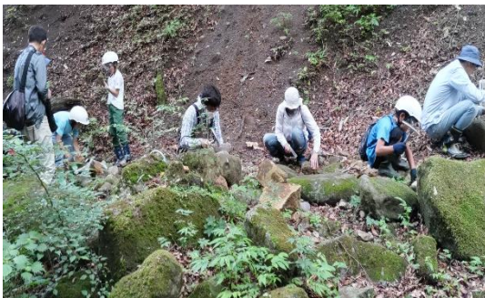
親子『化石発掘隊』事業より

報告事項では、「協議会の運営、ジオサイトの整備及び維持管理、人材育成、普及啓発事業」(以下「主要4項目」という)について事務局から報告いたしました。