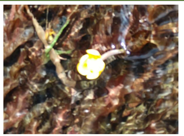
シモツケコウホネ