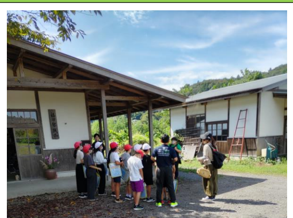
9月25日(金) 境小学校5年生 川の観察会等 小原沢地区