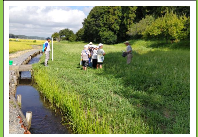
9月1日(金) 江川小学校3年生 シモツケコウホネの観察会 下川井地区