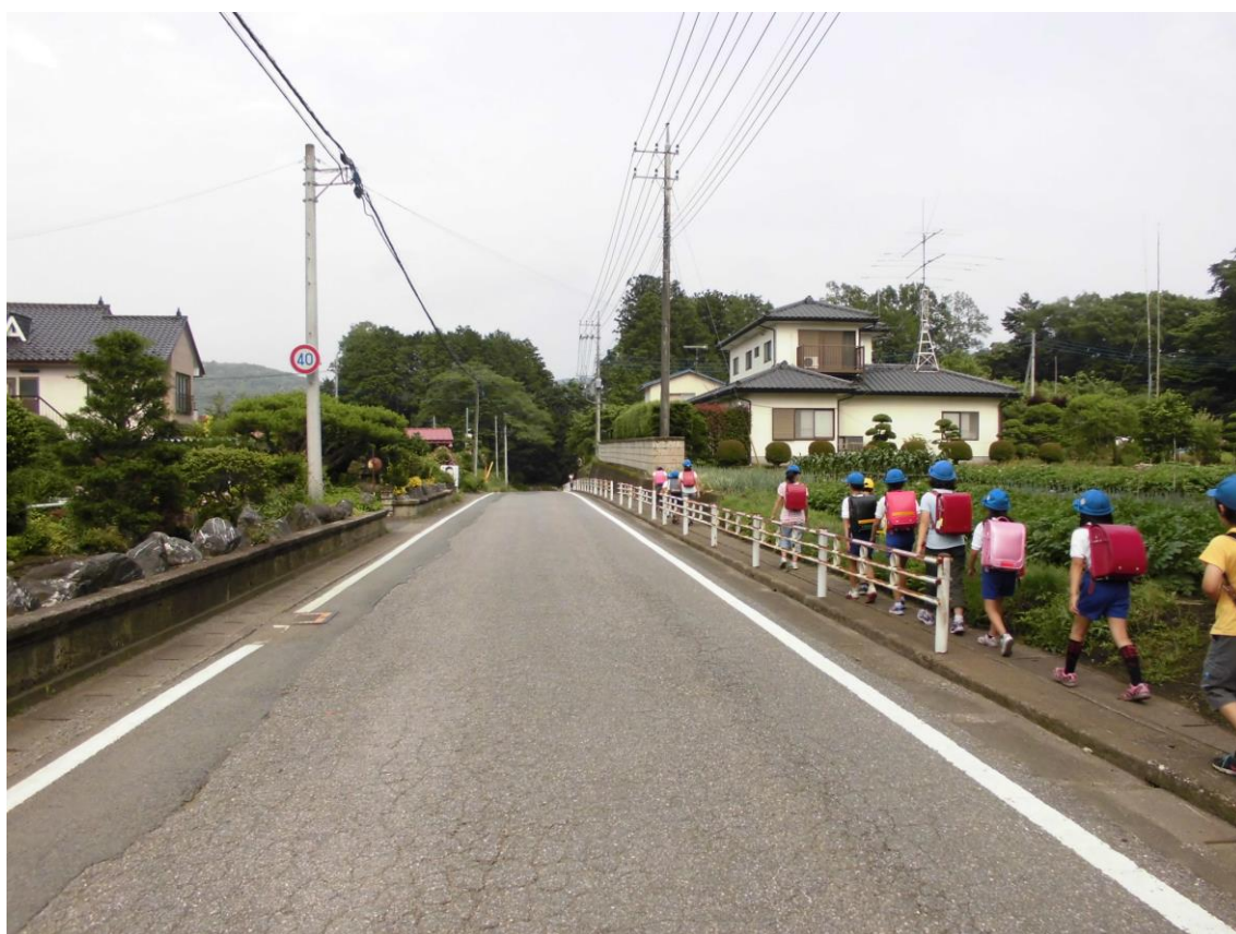
歩道が狭く危険な通学路（谷浅見地内）