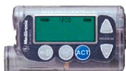
パラダイムインスリンポンプ 712/722 日本メドトロニック(株)