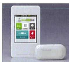
メディセーフウィズ テルモ(株)