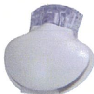
ミニメド620G/640Gトランスミッタ ガーディアンコネク iPro2 日本メドトロニック(株)