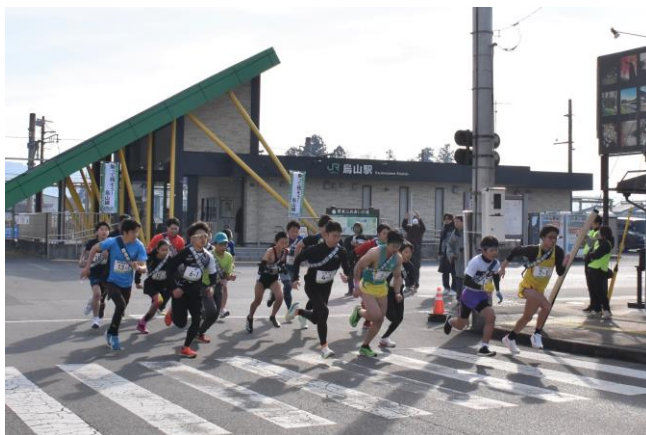
昨年の駅伝競走大会の様子