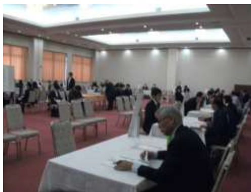
〈参考〉過去開催時の様子