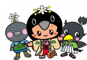
やまどん ここなす姫 からすまる ©那須烏山市