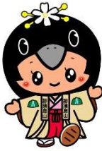
ここなす姫