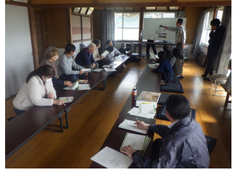
当日の様子（下境地区）

主な議題は「住宅団地の区画割の決め方」で、希望する区画についてや、話し合いによる方法や抽選による方法などについて参加者同士意見交換が行われました。