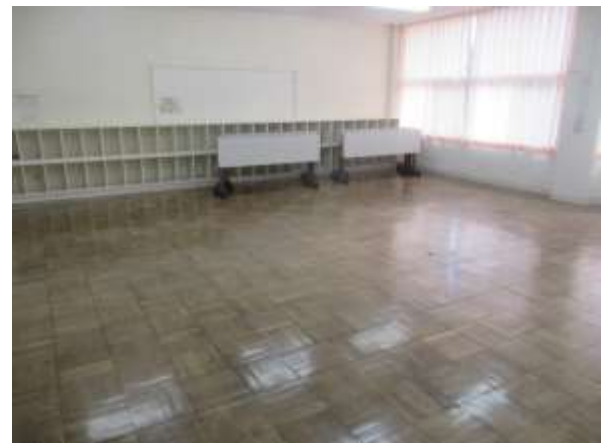
201会議室(2階、エアコンあり)