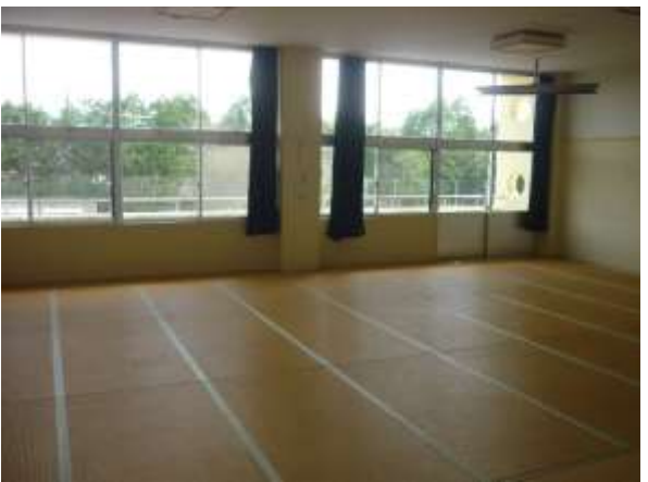
和室会議室(2階、エアコンあり)