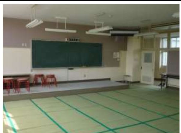
302会議室(3階、エアコンあり)