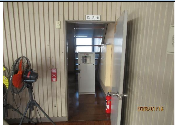
ステージ左側倉庫(放送室)