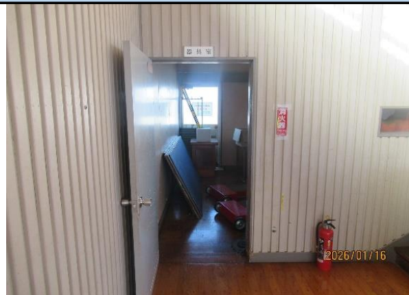
ステージ左側器具庫