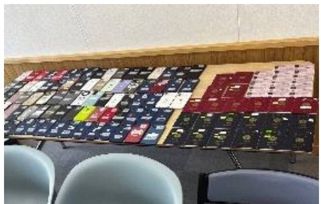
(右) 犯行グループが渡航者から没収していた携帯電話、パスポート、身分証等