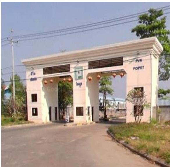
(左) 詐欺拠点の門扉